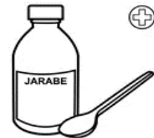
ME TOMO LAS MEDICINAS