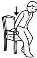
ME SIENTO CORRECTAMENTE