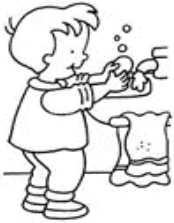
ME LAVO LAS MANOS