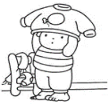
ME ABRIGO SI HACE FALTA