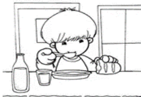
COMO DE TODO